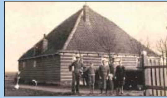
Boerengezin uit Waterland. 11e - 13e eeuw

Ontginning van het woeste veengebied van Waterland. Sloten zorgen voor droge grond in het drassige gebied. Met inklinking, bodemdaling en overstromingsgevaar tot gevolg. Op de Waterlandse veenweiden is uiteindelijk alleen veeteelt mogelijk.