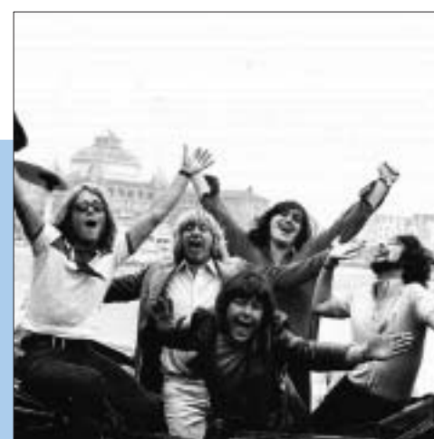
The Cats.