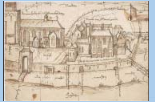
Klooster Mariëngaarde in Monnickendam met links de Grote Kerk.

Het geloof is belangrijk, ook voor de ontginners van Waterland. Zo krijgt ieder dorp zijn eigen kerk. Eerst nog van hout, vanaf de 13e en 14e eeuw in steen. In de 14e en 15e eeuw komen er ook enkele kloosters, waar monniken of nonnen werken.