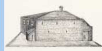
Doopsgezinde Vermaning te Purmerend.