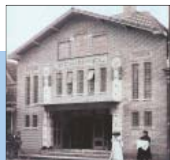
Cinema Schinkel van Oud.