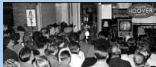
TV kijken bij Zijp in Purmerend.

Televisie komt in de huiskamer en bij (vrijwel) iedereen een auto voor de deur. De welvaart neemt sterk toe vanaf rond 1960 en uit oude arbeidersbuurten trekken velen naar de nieuwbouwu wijken, zoals die ook rond Purmerend worden gebouwd.