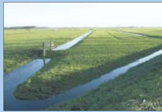
Verkaveling rond Hobrede.

aantal gevallen overlapt de canon van de vaderlandse geschiedenis die van de Waterlandse. Veel gebeurtenissen en ontwikkelingen deden zich nu eenmaal landelijk of zelfs wereldwijd voor, maar meestal hadden die op één of andere manier toch wel degelijk een Waterlandse exponent. Het overzicht dat nu gepresenteerd wordt is allereerst minst klaar. Sterker nog: het is eigenlijk nog maar een begin van wat de canon uiteindelijk zou moeten worden. Misschien zitten er onderdelen in die er eigenlijk helemaal niet in thuishoren. Wellicht ook ontbreken er belangrijke zaken. Commentaar en aanvullingen zijn dan ook van harte welkom. Aan de hand daarvan kan de canon in de loop van de tijd worden aangepast. Reacties kunnen worden gestuurd naar het Waterlands Archief, info@waterlandsarchief.nl , of naar de redactie van Dagblad Waterland, redactie.wat@noordhollandsdagblad.nl .