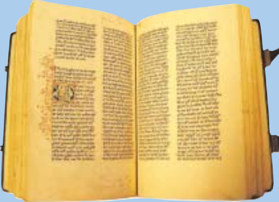
Boek uit het klooster Galilea Minor te Monnickendam.

De boekdrukkunst brengt boeken binnen het bereik van burgers. Tot dan toe worden de handgeschreven, dus dure boeken, alleen door geestelijken en een welgestelde minderheid gelezen. Door het zelf lezen van de Bijbel ontwikkelen veel mensen een eigen visie op het geloof en worden ze kritischer ten aanzien van wat in de kerk wordt geleerd.