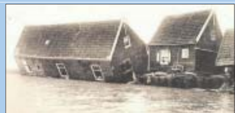
Watersnood op Marken.