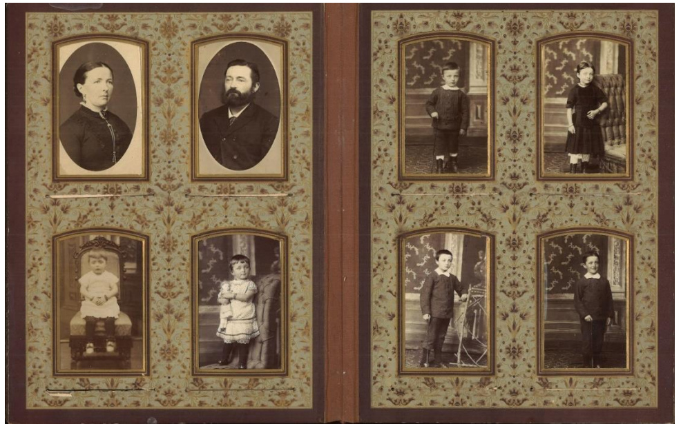
Album met Cartes-de-viste (niet in beeldbank, scan beschikbaar)

Tussen 1890 en 1920 waren de cartes-de-visite, op karton geplakte foto's, erg populair. Deze foto's werden vaak in fraaie albums opgeborgen en kregen een prominente plek in huis. Bijvoorbeeld in de gang op een speciaal tafeltje, of in de salon. De albums werden regelmatig bekeken door het gezin of als er familie op bezoek was. Het nadeel van vele albums is dat meestal geen namen zijn vermeld. Maar we kunnen ontzettend veel indrukken opdoen over de ontwikkeling van bijvoorbeeld mode, haardracht, sieraden, kinderkleding en speelgoed.