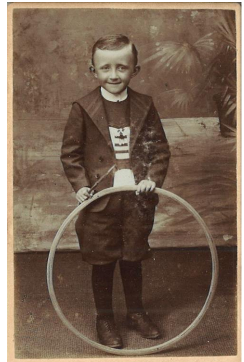
Dit jongetje kreeg van de fotograaf een hoepel om mee te poseren.

Wie kon investeren in apparatuur en een aardige studio inrichtte, kon een goede boterham verdienen met het maken van portretten. De meeste professionele fotografen fotografeerden in hun studio, later ook buiten of bij particulieren thuis. De studio was een ruimte met veel natuurlijk licht en ingericht met een aantal vaste elementen zoals een geschilderde wand (vaak een landschapsachtergrond), een bankje, stoel of krukje, een hekje of zuil. Maar ook geschilderde attributen zoals een boot of auto. Het was belangrijk dat de te fotograferen persoon/personen ergens op konden zitten of leunen want men moest over geduld beschikken en enige tijd stil staan vanwege de lange belichting en sluitertijd. Kinderen werden afgeleid door hen met speelgoed te portretteren.