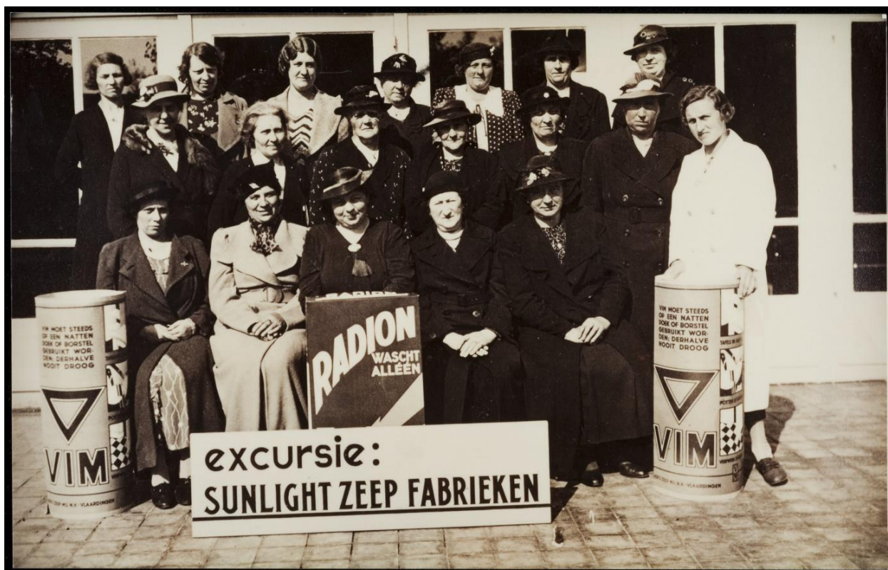
Fotonummer WAT050001728: 1930, Vrouwen uit Monnickendam op excursie bij de Sunlightfabrieken.

In de beeldbank van het Waterlands Archief zijn de namen van de dames opgenomen: